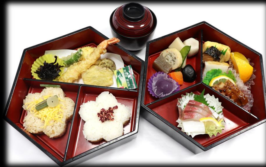
六角二段重箱 1,650円(税込) 235×205mm