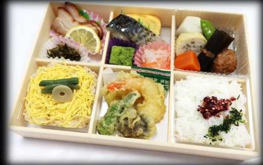
幕の内折詰 1,320円(税込) 250×170mm