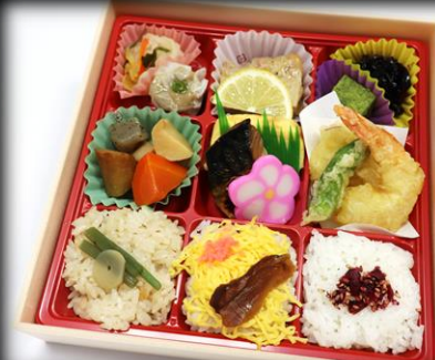
幕の内折詰 1,100円(税込) 200×200mm