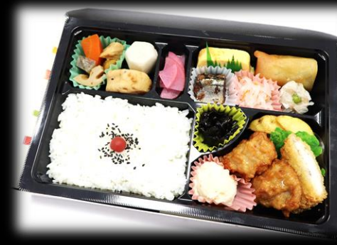
幕の内折詰 880円(税込) 275×180mm