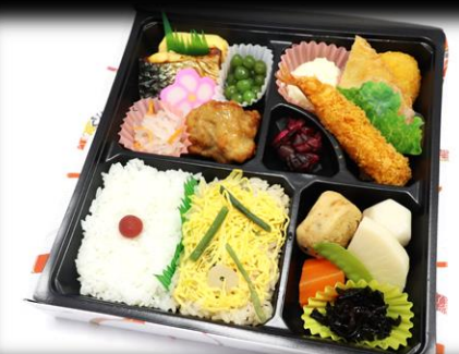
幕の内折詰 1,100円(税込) 225×225mm