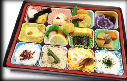
幕の内折詰 1,650円(税込) 280×195mm