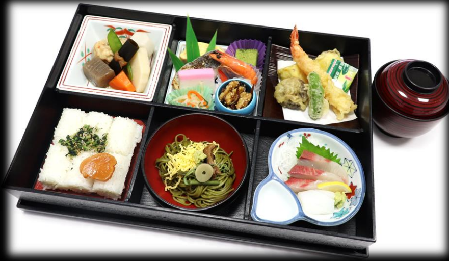
松花堂重箱 2,200円(税込) 365×245mm