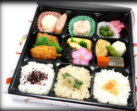
幕の内折詰 880円(税込) 225×225mm