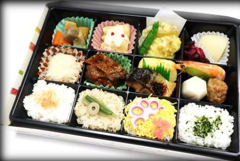
幕の内折詰 1,320円(税込) 275×180mm