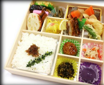
幕の内折詰 1,650円(税込) 210×210mm